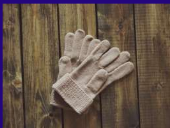
Des gants Glavu mikononi