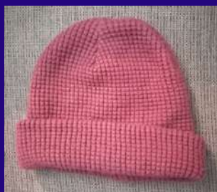
Un bonnet Kofia la baridi