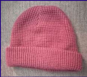
Un bonnet قبعة