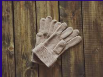
Des gants قفازات