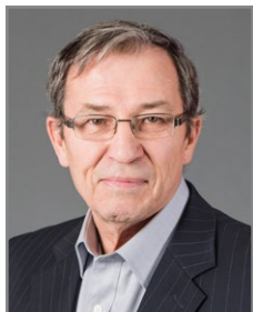
Circonscription 9 – De la Cité-Universitaire Harold Gaboury