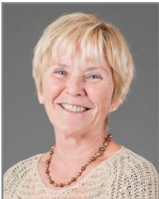
Circonscription 2 – De la Promenade-des-Sœurs Mary Fortier